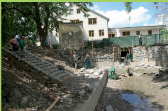
Výstavba nového požeráku a bezpečnostního přelivu