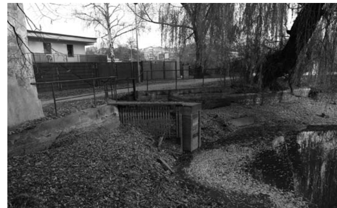
Vypouštěcí zařízení před rekonstrukcí (vpravo) a po re- konstrukci (dole)