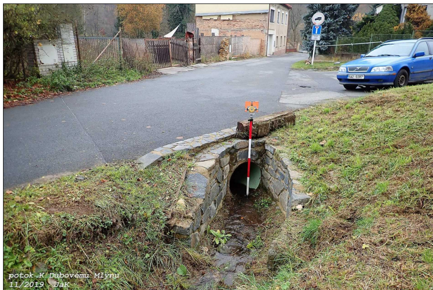
přítok K Dubovému Mlýnu 11/2019 JAK

O2P KM 0,088 0 – PROPUSTEK D600, DL. 10,0m (návodní strana) M 1:100/100